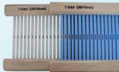
従来の箒そうこう