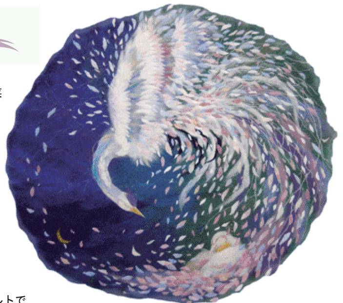
長い別離ーバーバラへの手紙ー

出来上がった作品から、優しさが流れ出てくるような、色彩に包み込まれるような、ホッとさせる空気を生み出すものを創りたいと思います。私はいつもマイペースで作品を作っています。私の作品を見てくれた人の胸に留まり続け、何年後、何十年後にもふと色鮮やかに生き生きと記憶に甦るような力を持った作品を作れるようにしたいと思っています。