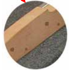
サイドポスト取り付けの穴が追加されます。