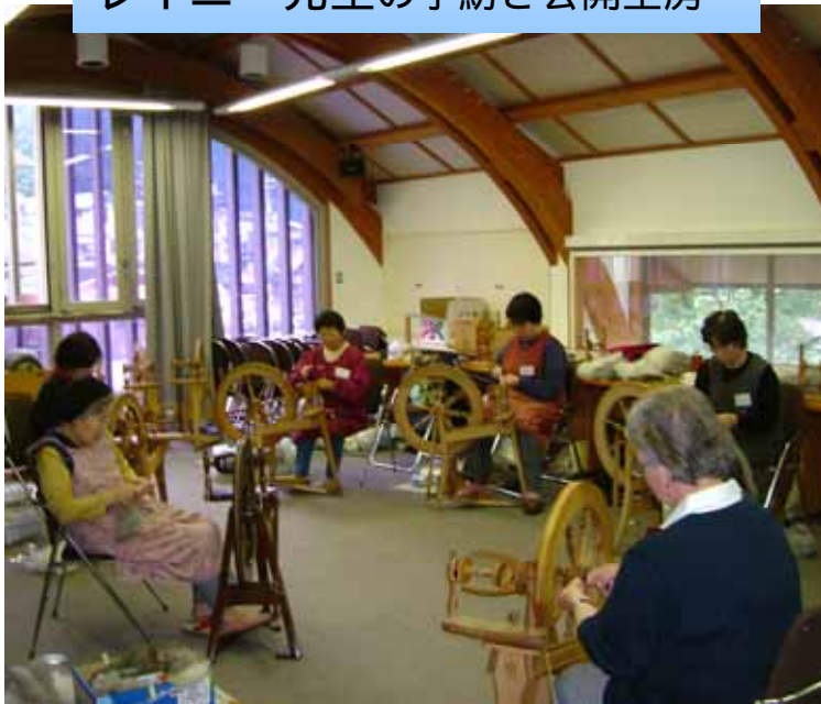
スラブヤーンを紡いでいるところです。