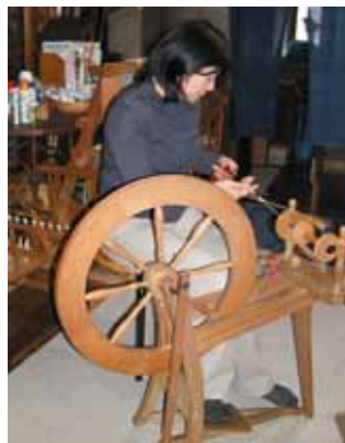
ゆったりとした時間が流れる森さんの紡ぎ。