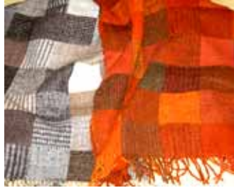
本の表紙になっている作品（左）。本当に暖かい。

先ごろ出版された「ホームспанテクニック」は羊の特徴、染色（化学・天然）、カーティング、紡ぎ、織り、仕上げ etc. と全工程を丁寧に解説し、細かな知識も満載の技法書です。「言葉や写真では伝えきれない部分がある。」とおっしゃっていましたが、染織の学校やホームспанの工房が数少ないという実情、この「ホームспанテクニック」が役立つことは間違いなし！