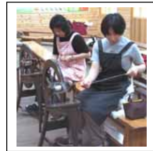
ロングドローでスピニング